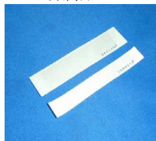
連番付き透明封印シール (2枚)

サミーの新機種「パチスロ北斗の拳 強敵」では筐体が一新されサブ基板も強固に側面に設置されています。しかしながら前作「転生の章」同様にサブ基板上のロムが交換される懸念も考えられます。「MKP 8 7 L」はサブ基板を防護すると同時に付属の連番封印シールにて脱着時の痕跡を残し、店内管理が可能です。