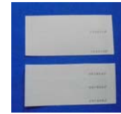
MKC-51 (2種1組 封印シール5枚付属)